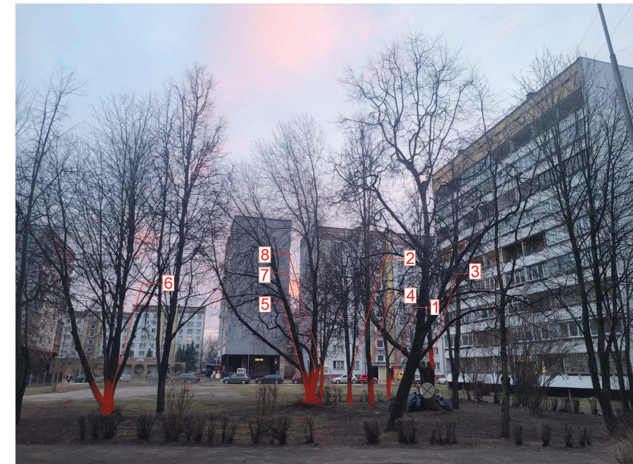
Cērtamo kokaugu fotofiksācija, attēls Nr.2