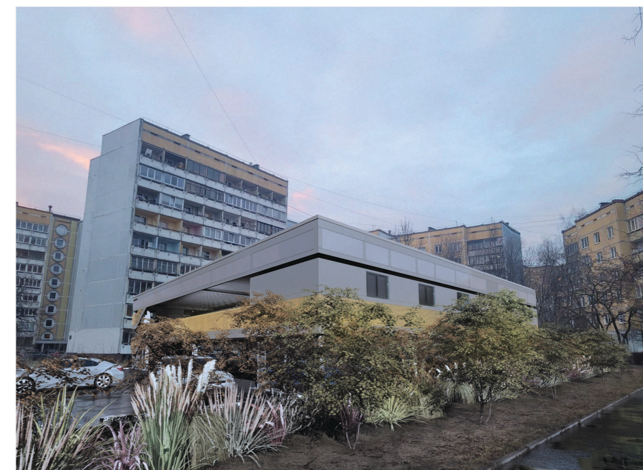
Vizualizācija - skats no pamatskolas bērnu sporta laukuma puses