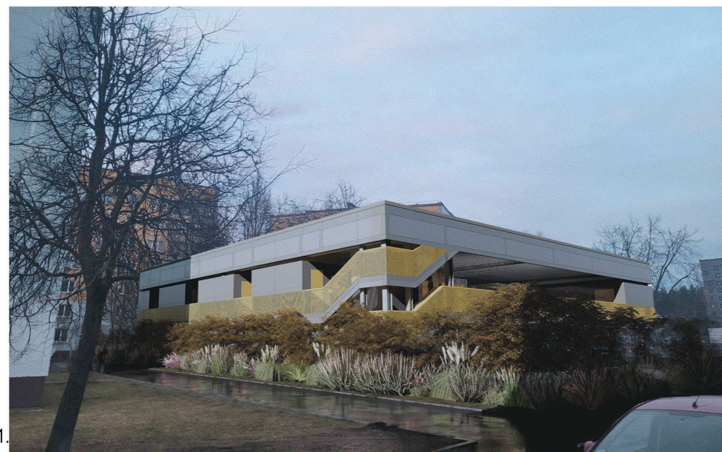
Vizualizācija - skats no Tīnūžu ielas puses