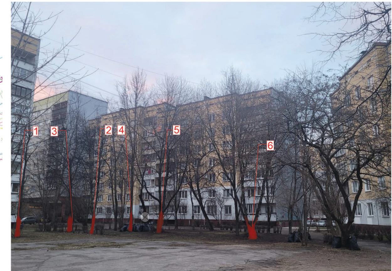
Cērtamo kokaugu fotofiksācija, attēls Nr.1